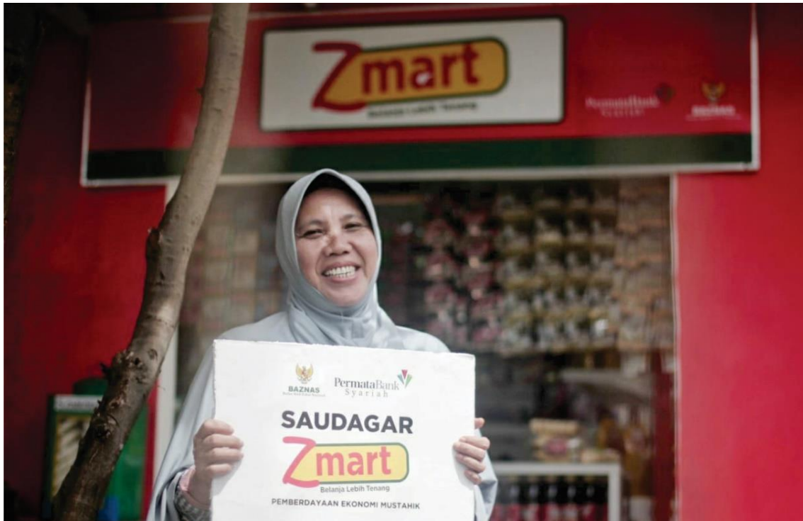
Gambar 3. Pemberdayaan ekonomi mustahik pada masa pandemi Covid-19 melalui Program Zmart