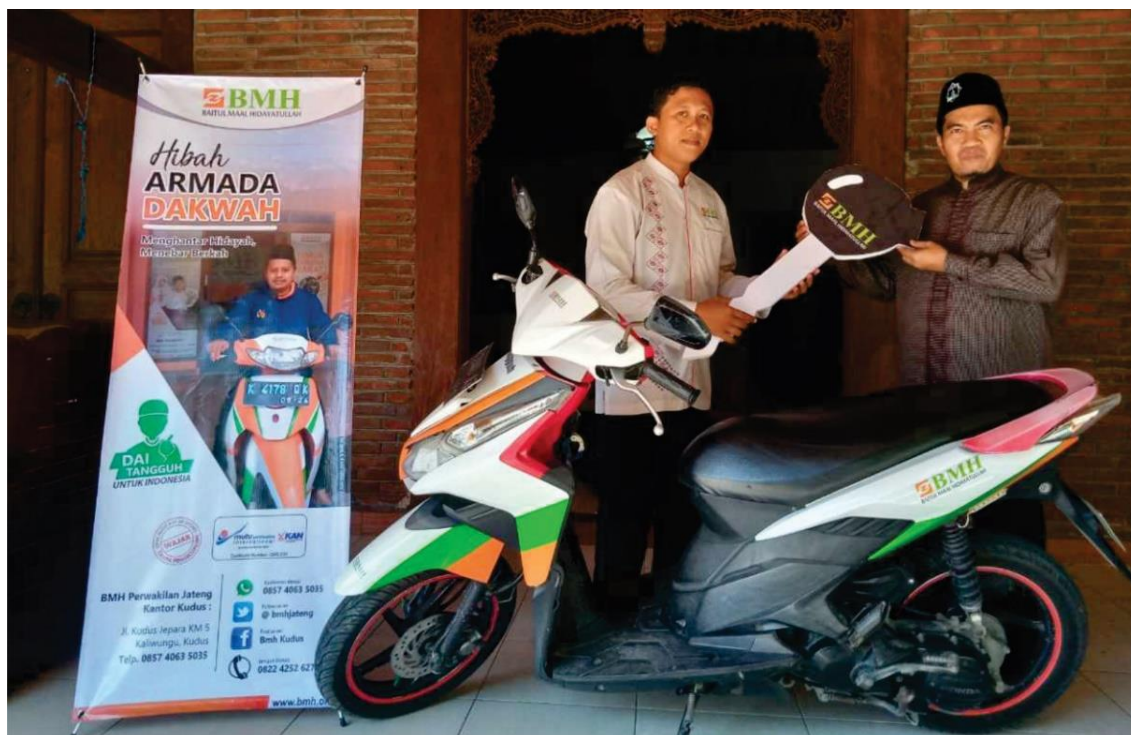
Gambar 7. Program Dai Tangguh dari LAZ Baitul Maal Hidayatullah