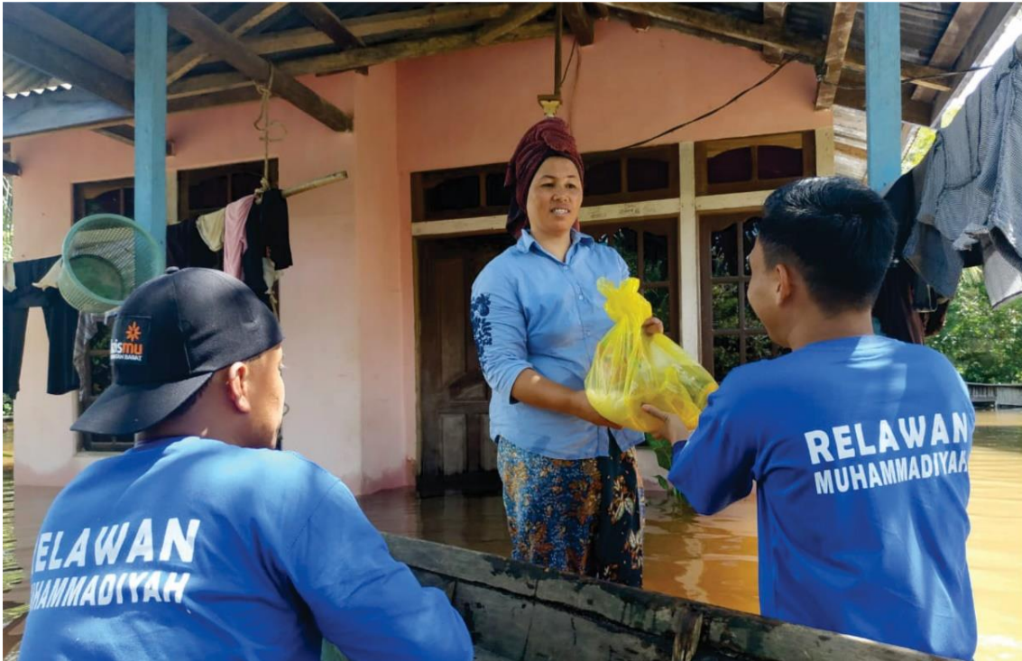
Gambar 4. Lazismu memberikan bantuan korban bencana banjir di Kota Batu yang tersebar di lima titik