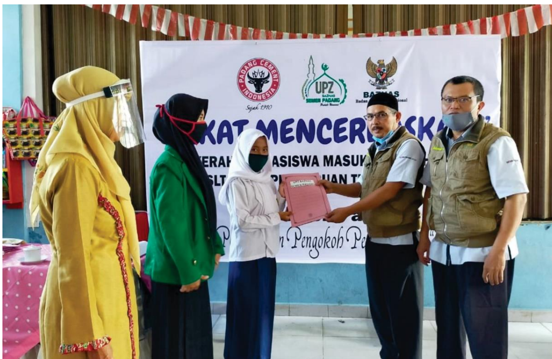
Gambar 5. Unit Pengumpul Zakat (UPZ) BAZNAS Semen Padang menyalurkan bantuan pendidikan berupa biaya masuk sekolah kepada 1.368 pelajar dan mahasiswa