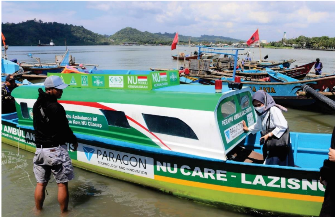
Gambar 6. NU Care-LAZISNU bersama PT Paragon Technology and Innovation menyalurkan bantuan perahu ambulans untuk warga Kampung Laut, Kabupaten Cilacap