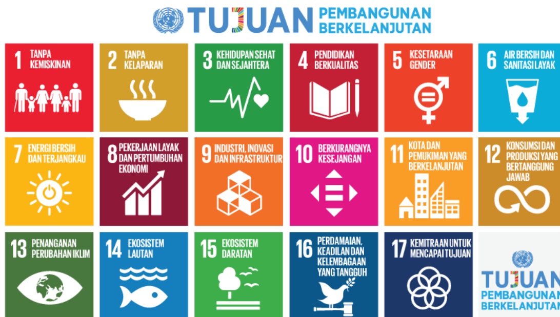
Gambar 2. Tujuan Pembangunan Berkelanjutan (TPB)

mampu menjaga peningkatan kualitas hidup dari satu generasi ke generasi berikutnya. TPB/SDGs merupakan komitmen global dan nasional dalam upaya untuk menyejahterakan masyarakat mencakup 17 tujuan. Upaya pencapaian target TPB/SDGs menjadi prioritas pembangunan nasional, yang memerlukan sinergi kebijakan perencanaan di tingkat nasional dan di tingkat provinsi maupun kabupaten/kota.